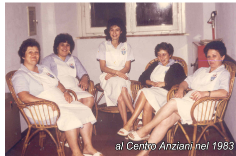
al Centro Anziani nel 1983

In questi anni altri dipendenti della Misericordia hanno raggiunto il felice traguardo, a testimonianza di una correttezza di trattamento normativo e retributivo che ha caratterizzato, da sempre, il rapporto della nostra Associazione con i propri dipendenti; ed a tutti abbiamo sempre espresso il ringraziamento per il buon