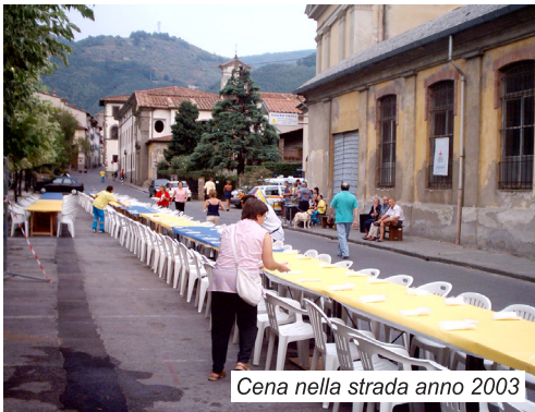
Cena nella strada anno 2003

La fortuna arride agli audaci, potrebbe essere il primo commento alla splendida CENA SOTTO LE STELLE che si è tenuta, come tradizione, nel giardino del Convento di San Francesco per sostenere le attività della Misericordia di Borgo a Mozzano.